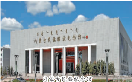
内蒙古民族纪念馆