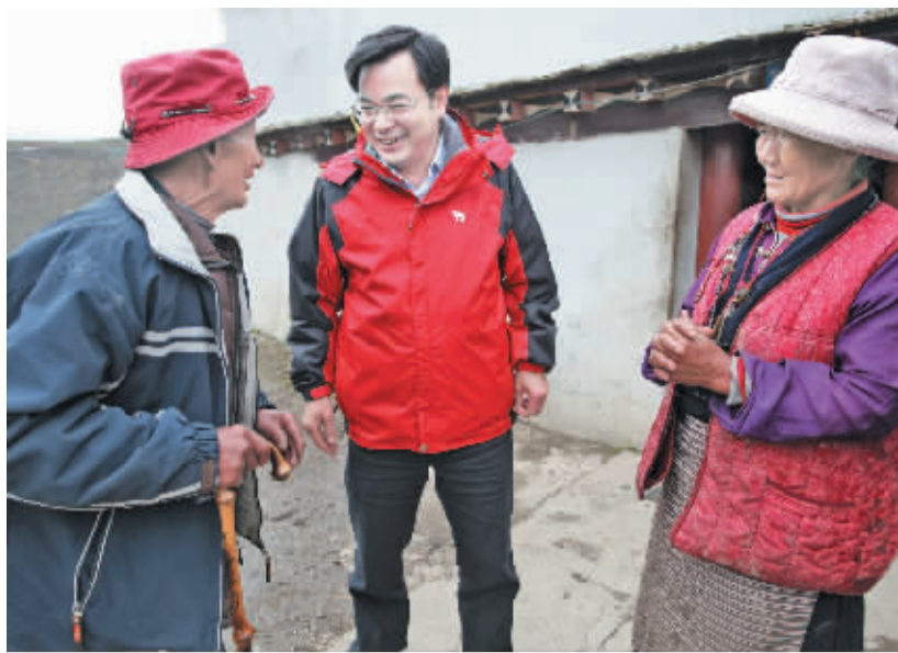
■ 本报记者 袁飞文/图

8月23日,刚进入秋季的康巴高原迎来了2012年的第一场雪,风雪弥漫高原大山,严寒冷气袭人身心,但在海拔4500米的卡子拉山警务站旁的一楼藏房里,69岁的藏族老人阿罗德西却感受着春天般的温暖,正在我州南部调研的州委书记胡昌升在风雪天中专程来到他们家里,看望德西老人夫妇,为他们老两口送去了党和政府的深情关怀。 “老人家,你们生活过得还好吗?有什么困难需要我们解决吗?今天我代表省委、省政府来看望你们,你们生活过得还好吗?有什么困难需要我们解决吗?”一见到两位老人,胡昌升就像见到自己的亲人一样,紧