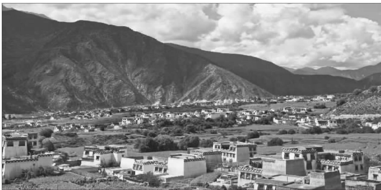
蓝天白云下的木差村。

实施美丽新农村建设是贯彻中央精神的需要,国家已将我州纳入生态功能区,省委、州政府要求,必须牢固树立“生态经济发展、绿色产业富民”的理念,坚定不移地走农旅结合、以旅促农、农旅互动的发展道路,整合上亿元资金,重点围绕国道317、318沿线村庄和成熟旅游景区选择美丽新农村建设,坚持“因地制宜,突出主题”、“政府主导,群众主体”的原则,准确把握“基础、功能、风貌、特色”四方面内容,突出抓好“生态、旅游、文化、建设”,充分发挥州、县、乡、村的积极作用,充分发挥各类技术人员的积极作用,充分发挥群众在工程建设中的主体作用,全力打造一批农旅互动、产村相融的美丽新村,真正让群众满意、游客满意。为此,本报从今日起特别推出《大美甘孜·美丽新村》栏目,敬请关注。