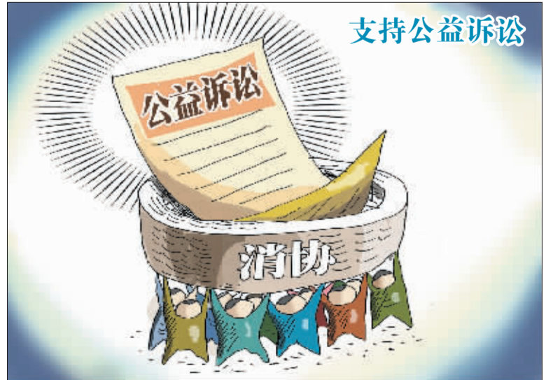
消费者协会就损害消费者合法权益的行为,支持受损害的消费者提起诉讼或者依照本法提起诉讼。