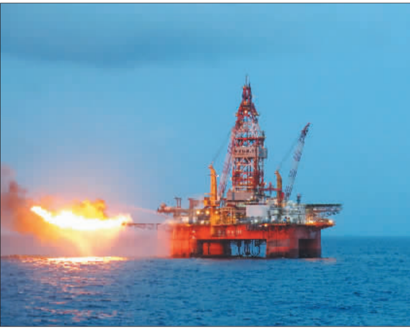
图为陵水17-2-1井近期测试获得高产油气流。

中国海洋石油总公司15日宣布,“海洋石油981”钻井平台日前在南海北部深水测试获得高产油气流。