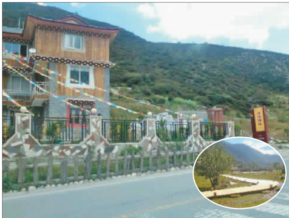
折多塘村一瞥。

通过现场检查,联机试运行检测后,验收组认为,新龙县环境监测站各项指标数据运行正常,采购的设备与省州的并网符合省站的标准和要求,该县环境空气质量自动监测系统各项技术指标均符合国家《环境空气质量自动监测技术规范》要求,符合相关验收标准,同意通过验收。