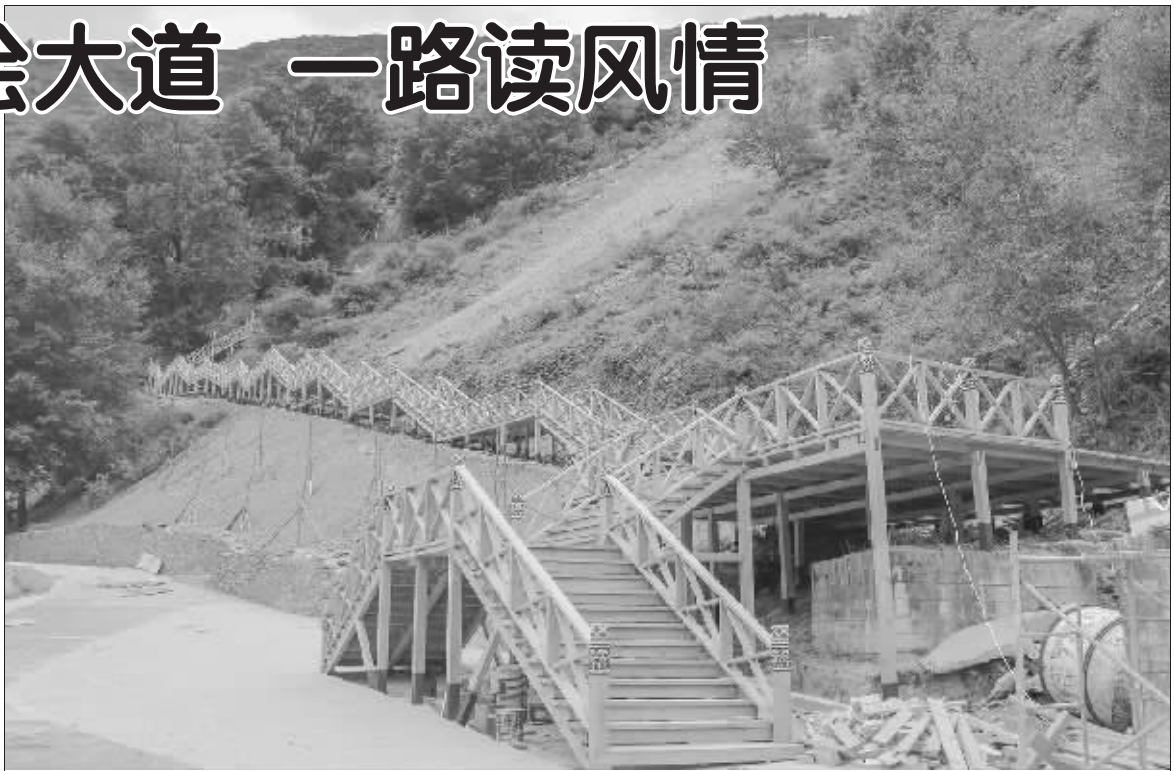
别具一格的木质长廊。