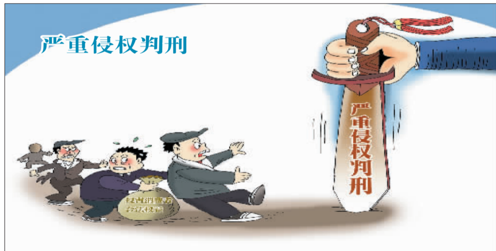
经营者违反本法规定提供商品或者服务，侵害消费者合法权益，构成犯罪的，依法追究刑事责任。