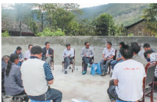
▲县委书记陈廷全在基层调研。