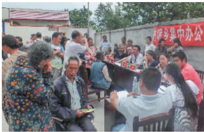
▲开展集中办公日活动。