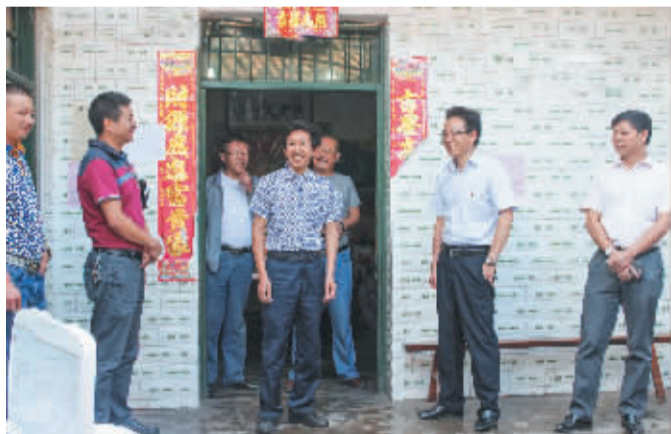
▲县委副书记、县长蒲永峰走访农家。