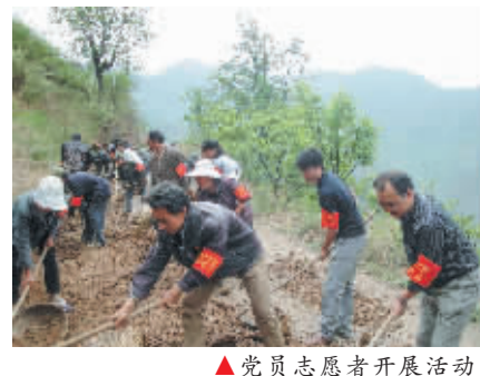
▲党员志愿者开展活动。

《甘孜日报》“甘孜商讯”本着“方便百姓，服务社会”的宗旨，发布酒店、餐饮、招聘、租赁、美容美发、转让、快递、票务、维修、搬家、家教、家政服务等方面的信息。随着本报微信客户端的推出，现隆重推出“康巴食尚”栏目，向广大消费者推介吃喝玩乐攻略，敬请关注。