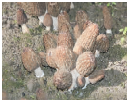
长势喜人的羊肚菌。