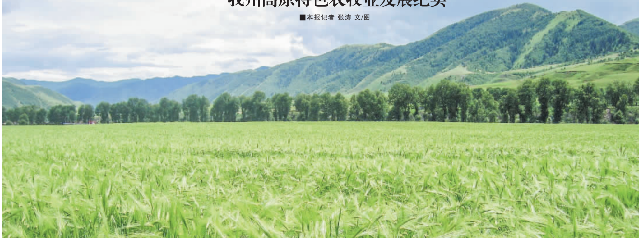
道孚县青稞良种繁育基地。

牧场上，牧民赶着肥壮的牛羊在自家的草场上放养；农区里，农民正在收割成熟的青稞、油菜；温室大棚中，各种蔬菜已成熟，菜农们忙着采摘……近年来，甘孜大地处处呈现出丰收后的幸福场景，展现着高原特色农牧业发展的新面貌。