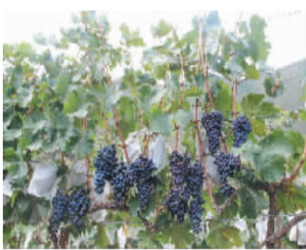
得荣县葡萄种植基地。

2014年，全州农业畜牧部门按照州委提出的“一优先、二有序、三加快”和农牧业“2423”发展思路，认真贯彻落实中央、省、州一系列重大决策部署，以“农业跨越发展、农民持续增收”为工作主题，着力深化农业农村改革，着力抓好草原生态保护建设，大力培育优势特色产业，全力夯实科技支撑，稳步推进高原现代特色农牧业发展，全州农牧业生产继续保持良好发展势头，农业生产实现“七连增”。农牧民收入持续增长，农牧民人均纯收入达到6353元，比上年增长16.9%。