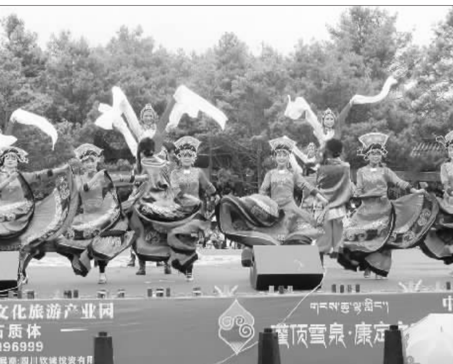
跑马山国际转山会。

今年3月6日,中国自驾游大会暨中国自驾游路线评选颁奖盛典在上海国际时尚中心隆重举行。来自旅游、汽车、互联