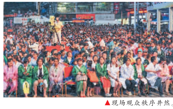
▲现场观众秩序井然。