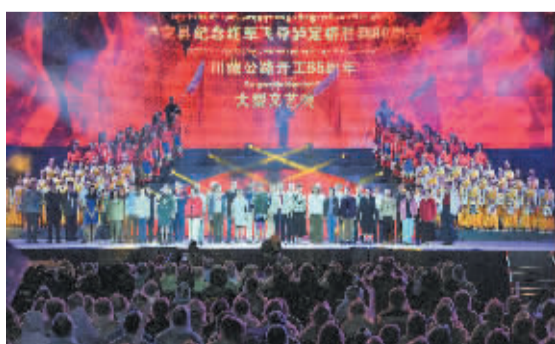
▲老一辈革命家后代冒雨演出。

晚会共分“美丽家园”、“红军飞夺泸定桥”、“川藏公路”、“开创未来”四个篇章,艺术性地展现了泸定的快速发展、光荣历史以及对美好未来的憧憬。歌舞表演《泸定飞歌》、《岷安锅庄》、《美丽家园》等节目精彩展现了近年来泸定在党委政府的领导下,建设美丽幸福新