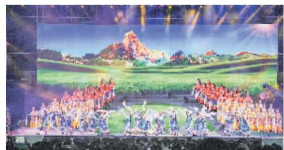
▲四川师范大学音乐学院师生同台演出《美丽家园》。