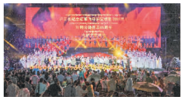
▲出席晚会的领导看望慰问演职人员并合影留念。

——泸定县纪念红军飞夺泸定桥胜利80周年暨川藏公路开工建设65周年《永恒的丰碑》大型文艺晚会掠影