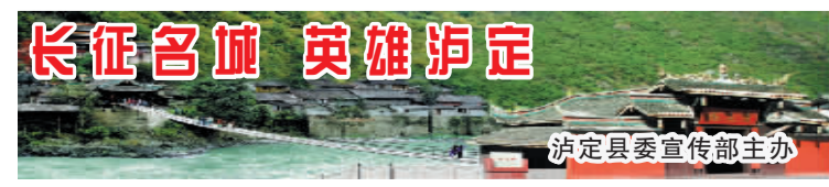
▲泸定县委宣传部主办。

《甘孜日报》“甘孜商讯”本着“方便百姓,服务社会”的宗旨,发布酒店、餐饮、招聘、租赁、美容美发、转让、快递、票务、维修、搬家、家教、家政服务等方面的信息。随着本报微信客户端的推出,现隆重推出“康巴食尚”栏目,向广大消费者推介吃喝玩乐攻略,敬请关注。 栏目热线: 0836-2835718 关注微信平台: 康巴传媒网 “康巴食尚” 滋滋烤鱼康定姑咱店