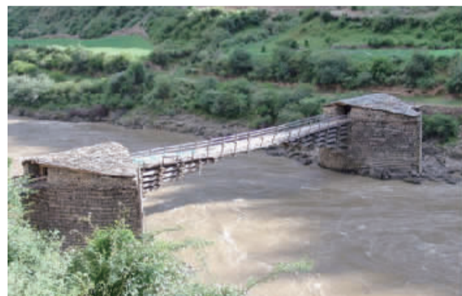
全国重点文物保护单位波日桥。