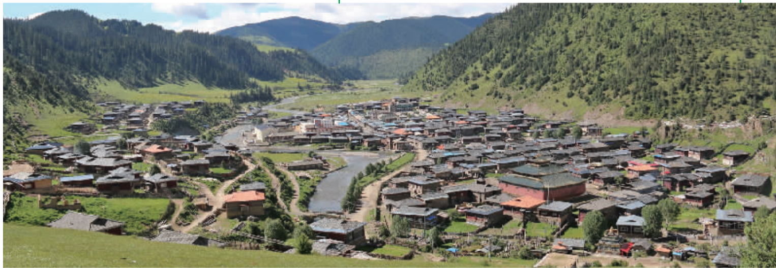
独具魅力的中国石板藏寨。