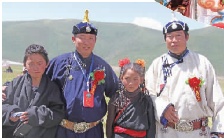
■内蒙古格学专家和色达牧民小孩一起合影