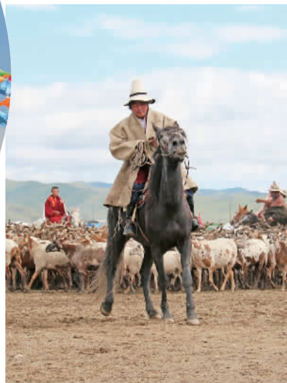
■红原县文艺汇演再现藏家游牧迁徙场面