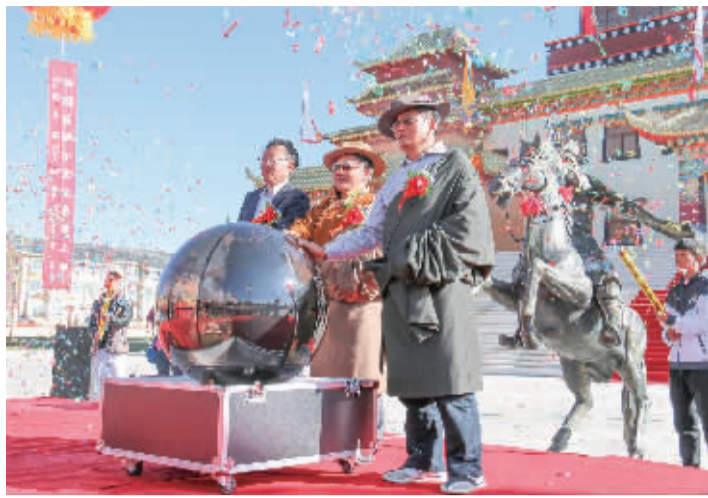
■格萨尔文化艺术中心开馆仪式