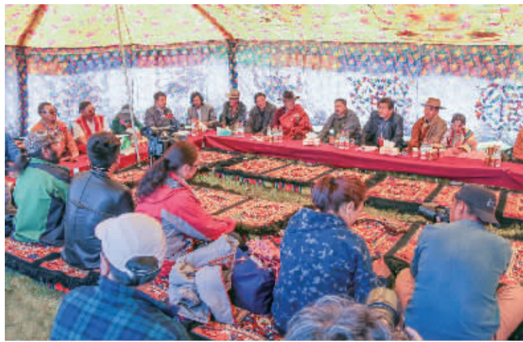
■五省藏区及内蒙、新疆等地格学专家进行格萨尔文化专题研讨