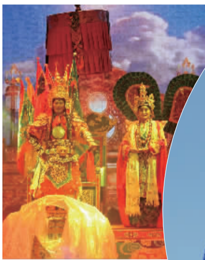
■藏戏(赛马称王)首演