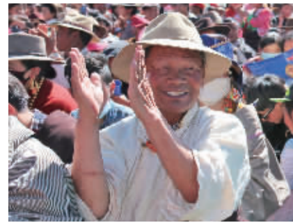
■色达牧民观看文艺演出显得特别开心