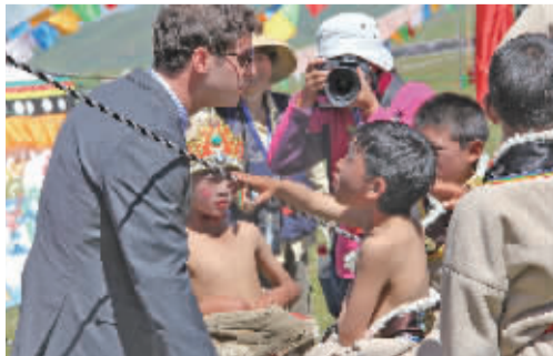
■外国友人三才和牧民小孩在一起互动