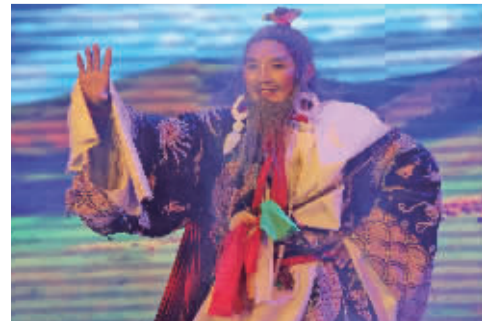
■“草原诗韵”文艺汇演现场