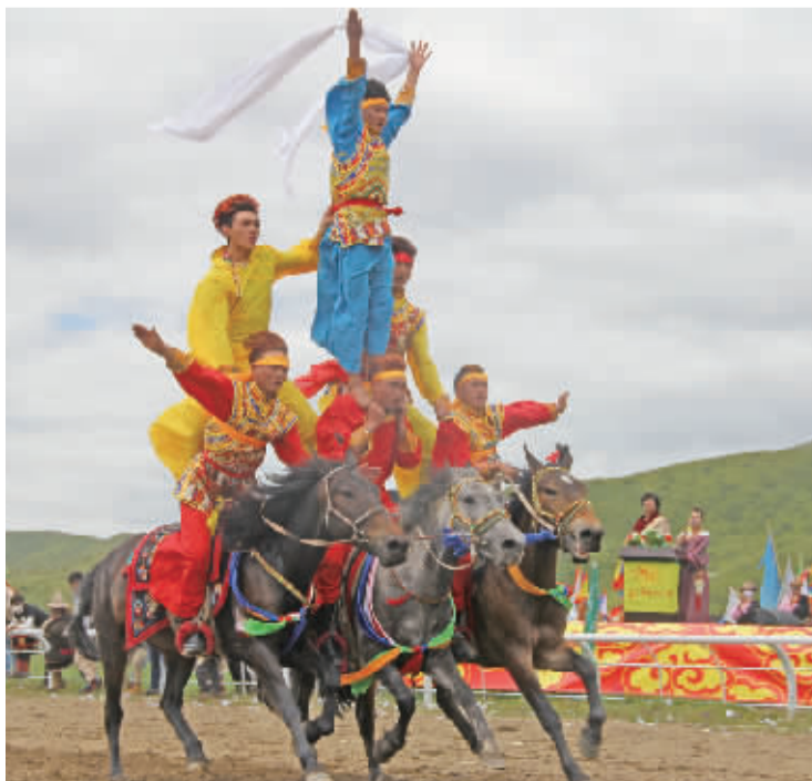
■阿坝县民间马术团精彩的马术表演

此次活动,旨在通过整合我州和阿坝州格萨尔文化资源,为格萨尔文化研究的专家学者提供一个近距离感受格萨尔文化的平台,全面展现两州在格萨尔文化研究领域取得的成果,打造“格萨尔故里”和“格萨尔艺术之乡”文化名片。