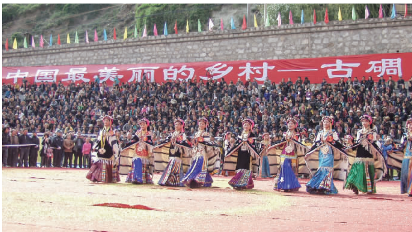
图为往届丹巴嘉绒藏族风情节现场。

丹巴举办嘉绒藏族风情节的习俗历史悠久,至少可以追溯到唐宋时期,最早是人们在庆祝丰收举行的庆祝活动,每当夏收或秋收之后的农闲期间,人们各自带着酿制的新酒,聚在一起,一边品尝美酒,一边跳起锅庄,尽情欢度丰收之后的闲暇时光,祛除一年的疲劳辛苦,久而久之便形成一种习俗沿袭下来,活动的规模越来越大,内容也越来越丰富。活动内容主要包括:品尝美酒、锅庄舞蹈表演、山歌情歌对唱、评选美女、民间杂耍等。到了明清时期,发展到部落之间或土司之间轮流作东,举行地区性的大型庆典活动。尽管在解放后,这种以嘉绒藏