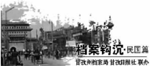
档案钩沉·民国篇 甘孜州档案局 甘孜日报社 联办