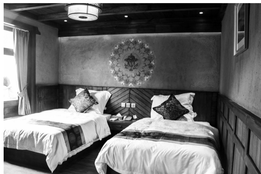
牧民定居房改造成了温馨的游客住房。