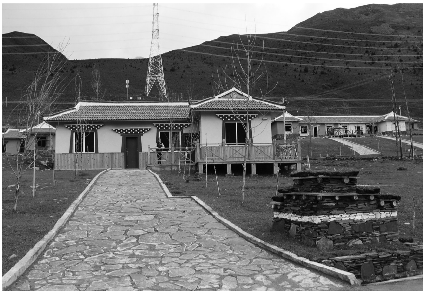
昔日的牧民定居点成为如今的旅游接待点。

6月27日,作为全州三个现场点之一,全省藏区脱贫攻坚现场会在俄达门巴村召开,省州领导及相关单位对俄达门巴村借力全域旅游推进扶贫攻坚的工作方法给予了充分肯定。