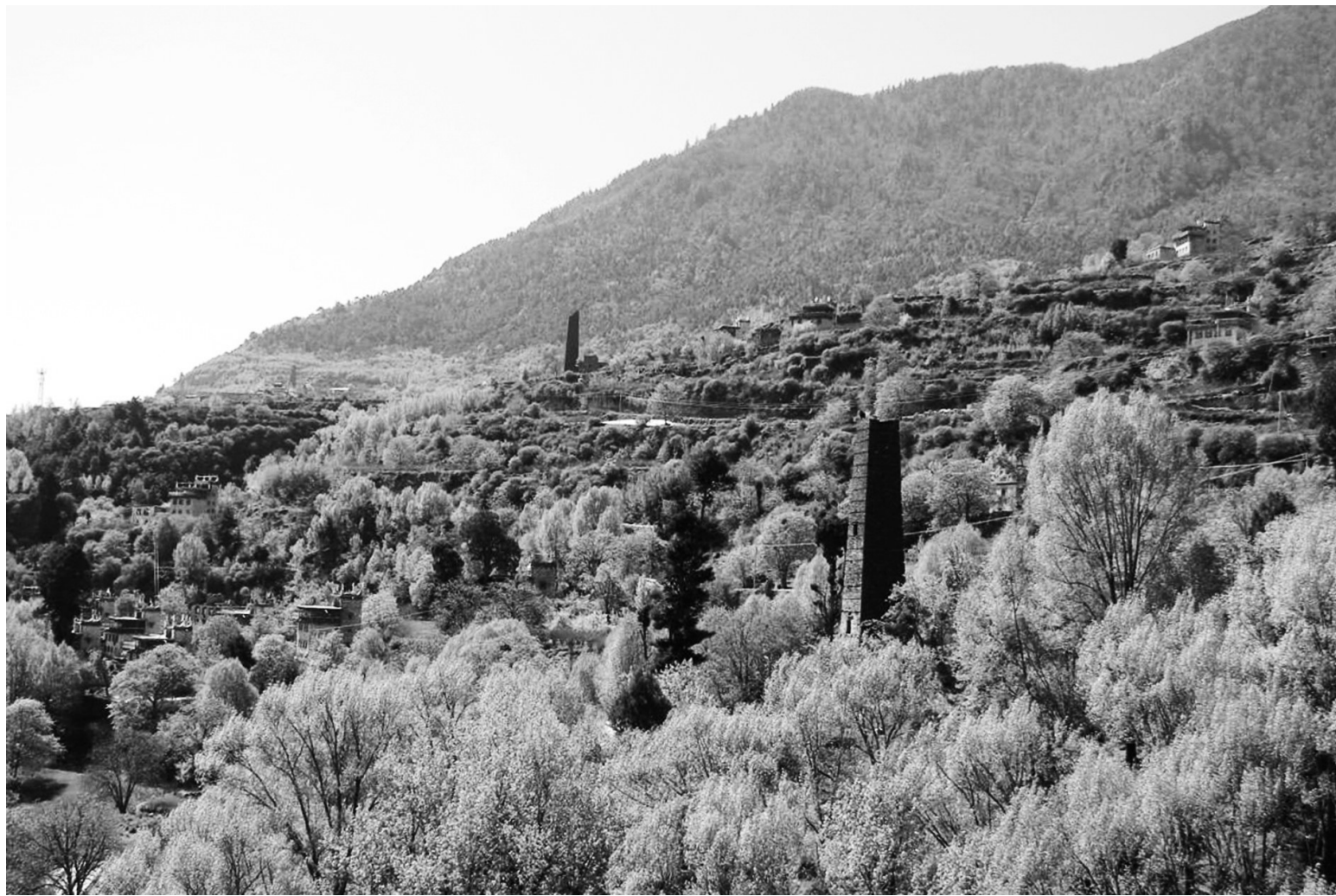
宋达村山顶的民居。

宋达村活动场是一个宽约二十米,长约三十米的大坝,里面是高约十米的石砌围墙,此时几个工人正在忙碌着,几座建筑模型已初见雏形,最左边是一座三角碉楼的模型,一名工人坐在碉楼的楼顶上拿着手锤正奋力的敲打着眼前的石片,那石雕一半露在墙外,还有一半巧妙的镶嵌在围墙里。笔者走上前去,来到“碉楼”下,整座碉楼都是用灰色的石片砌成,每个石片间距一致,几乎不见一点缝隙,充分展示了嘉绒人民高超的石砌技艺。三角碉楼,顾名思义,就是整座碉楼由三个角组成,在古时候是展示财富和地位的一种表现形式,砌墙的师傅非常健谈,他告诉我,在嘉绒地区,碉楼又以三角碉楼最为罕见,据说,如今残存的三角碉楼全世界都只有三座,而其中保护得最为完整的尤数梭坡乡普格顶村了,他顿了顿,伸出布满青筋沾满灰尘的手,往上指了指,自豪的说,它就在我们宋达村的山巅上,我不禁肃然起敬,为家乡拥有这样一座凝聚着嘉绒人民智慧结晶的古碉而激动不已。在三角