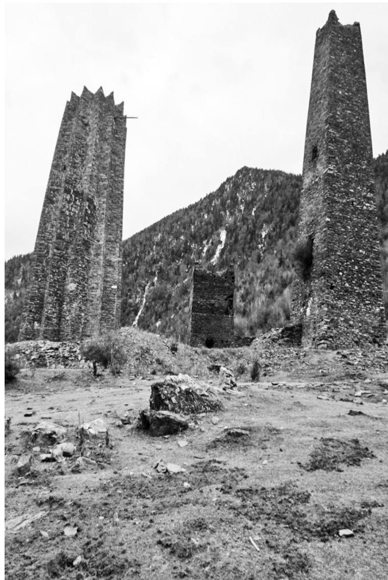
宋达村山顶的三角碉。