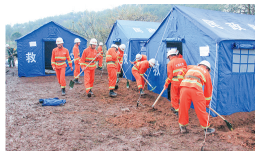
在云南省大理州漾濞县漾濞镇,救援工作正有序开展。