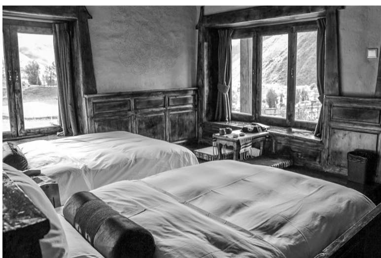
康定市新都桥贡嘎山庄酒店客房。