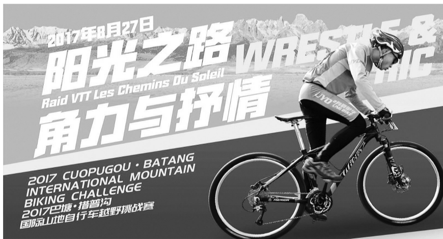
2017巴塘·措普沟国际山地自行车越野挑战赛宣传图。

配套活动主要包括:骑行闯天路四川资格赛香格里拉站骑行活动、旅游商品创意设计大赛、第二届龙腾亚丁天空跑和其他预热、推广活动。