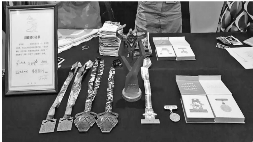
川藏骑行证书和奖牌。