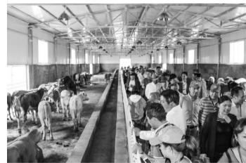
与会人员参观现代化养殖场。