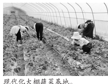
现代化大棚蔬菜基地。