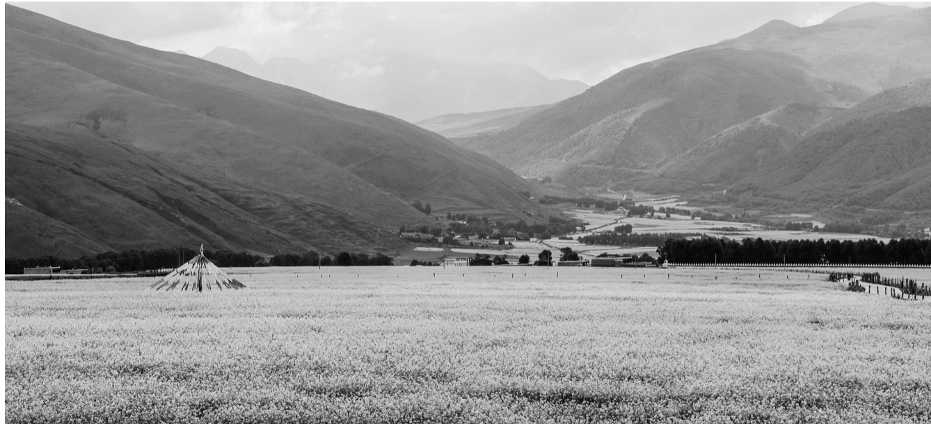
道孚协德万亩油菜基地。

据悉,“海峡两岸记者四川行”联合采访活动至今已成功举办16届,是两岸新闻交流的重点项目,宣传成效显著,在两岸具有广泛影响。