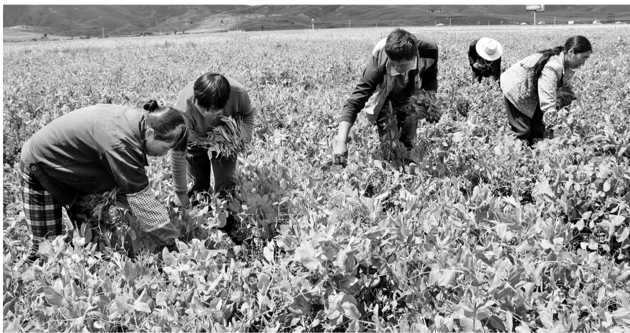
“订单式”农业让理塘农民坐地“淘金”。本报资料库图

日前,记者从州农牧供销合作局获悉,今年是贯彻党的十九大精神、实施乡村振兴战略的开局之年。按照中央和省、州委经济工作会议、农村工作会议安排部署,该局以提高质量和效益为中心,以促进农业供给侧结构性改革为主线,紧紧围绕“农业质量年”主题,认真落实“四个最严”要求,把增加绿色安全优质农产品供给放在更加突出位置,扎实推进质量兴农、绿色兴农、品牌强农。重点从以下五大方面推进农业质量年。