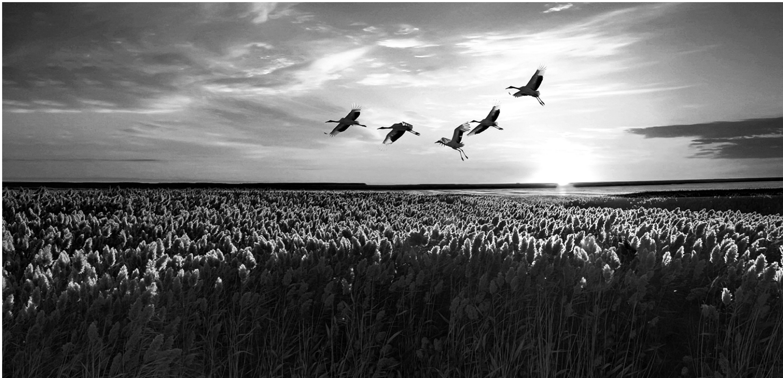
鹤舞夕阳。