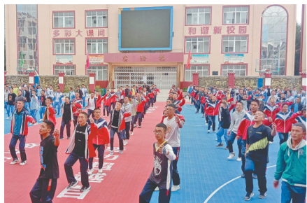
演职人员正在紧张排练参演节目。

甘孜日报讯 建州70周年盛典即将到来,各项准备工作进入倒计时,连日来,甘孜县参加建州70周年庆典的甘孜踢踏方队演职人员正抓紧排练。