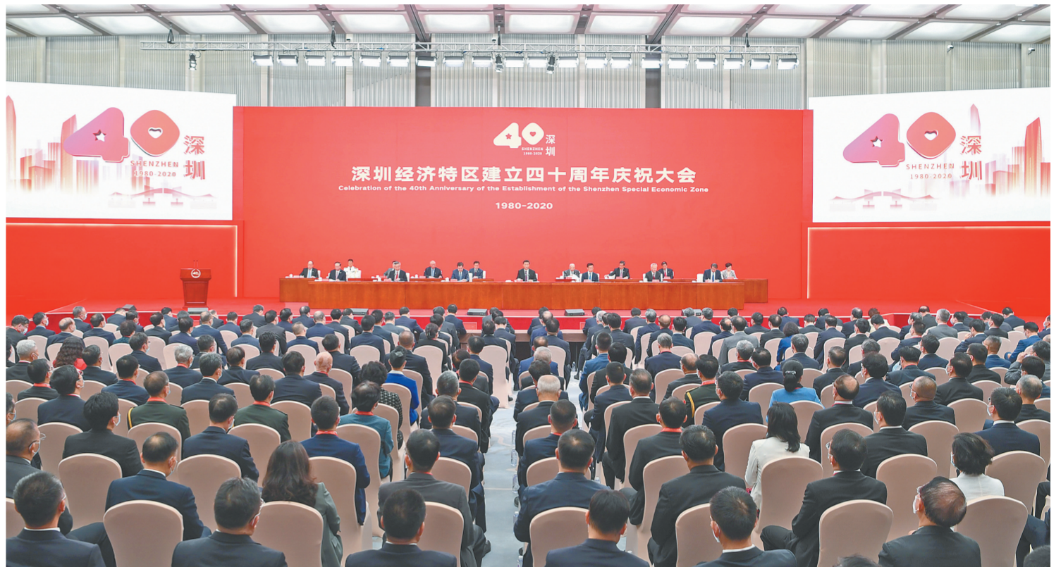
10月14日,深圳经济特区建立40周年庆祝大会在广东省深圳市隆重举行。中共中央总书记、国家主席、中央军委主席习近平在会上发表重要讲话。新华社发

深圳经济特区建立40周年庆祝大会14日上午在广东省深圳市隆重举行。中共中央总书记、国家主席、中央军委主席习近平在会上发表重要讲话强调,要高举中国特色社会主义伟大旗帜,统筹推进“五位一体”总体布局,协调推进“四个全面”战略布局,从我国进入新发展阶段大局出发,落实新发展理念,紧扣推动高质量发展、构建新发展格局,以一往无前的奋斗姿态、风雨无阻的精神状态,改革不停顿,开放不止步,在更高起点上推进改革开放,推动经济特区工作开创新局面,为全面建设社会主义现代化国家、实现第二个百年奋斗目标作出新的更大的贡献。