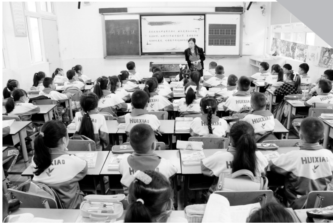
“開學第一課”課堂現場。