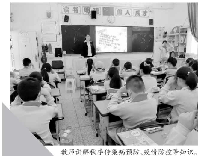
教師講解秋季傳染病預防、疫情防控等知識。