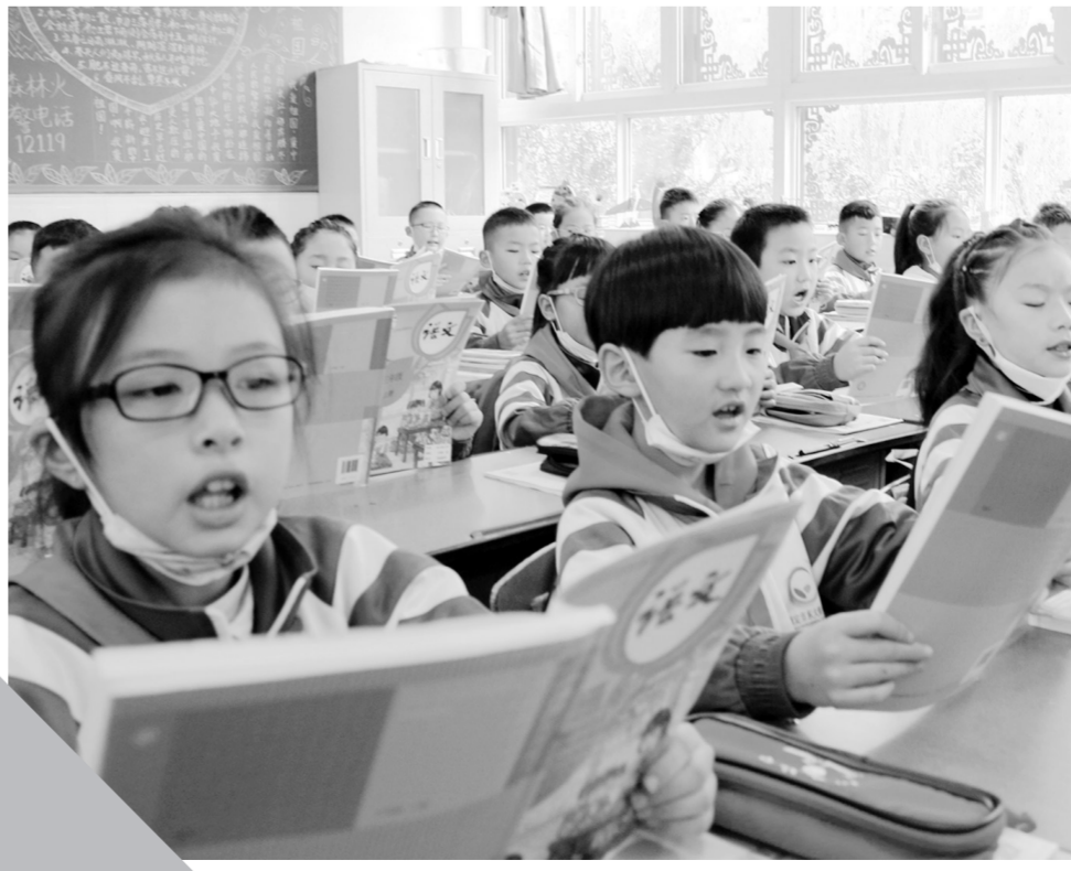
學生們在朗誦課文。