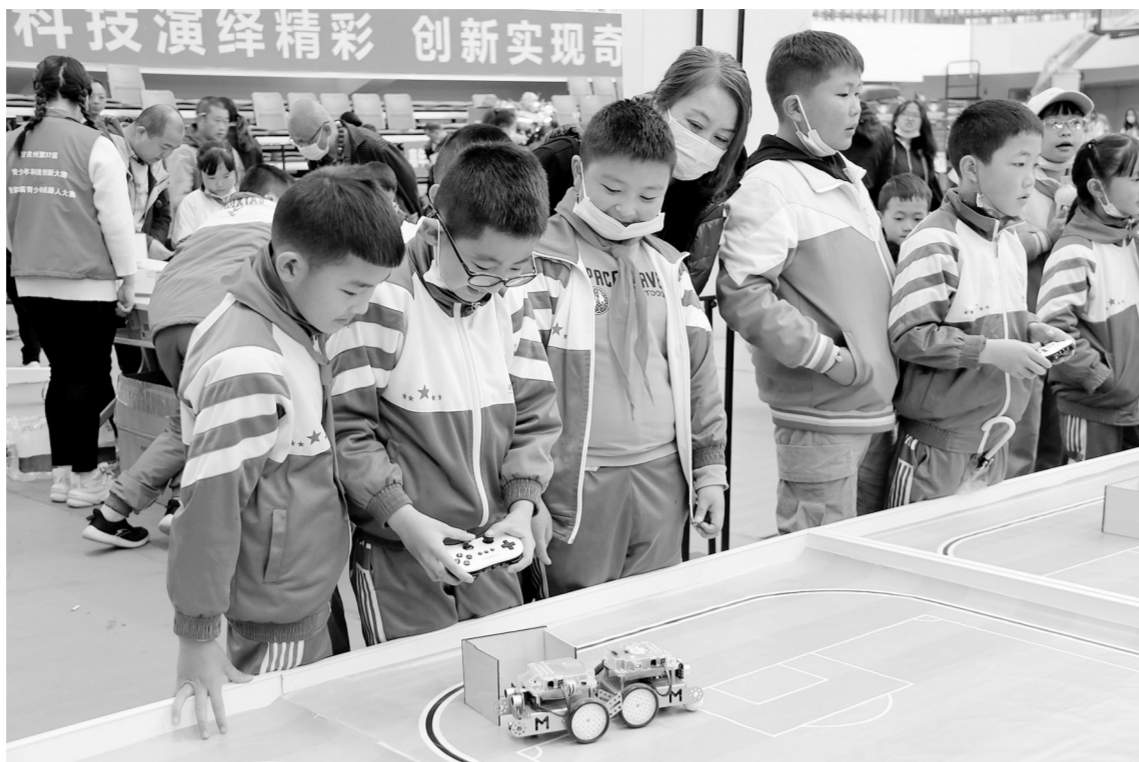
图为同学们兴致勃勃地体验科技的魅力。