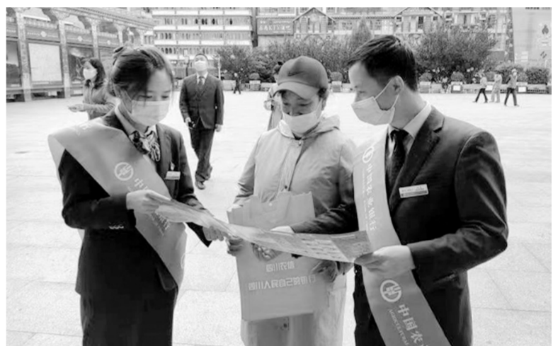
图为工作人员正在为市民讲解防金融诈骗相关知识。