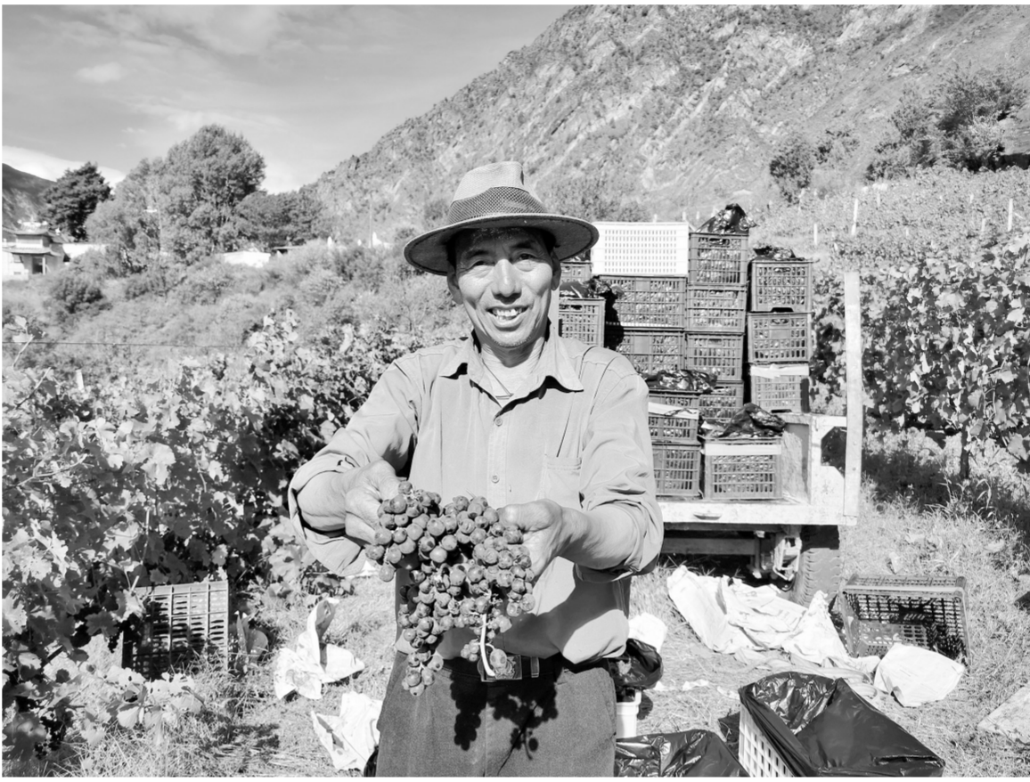
左比村村民喜收葡萄。