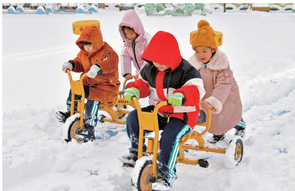
幼儿园小朋友在雪地里欢快游戏。

教育部、国家发展改革委、财政部等九部门日前印发《“十四五”学前教育发展提升行动计划》，围绕提高普惠水平、加强幼儿园规范监管、合理确定收费标准等提出系列举措。未来几年，“入园难”“入园贵”有望得到进一步缓解。 学前教育是整个教育体系最薄弱的环节。近年来，通过连续实施多期“学前教育行动计划”，学前教育普及普惠水平有所提升，2020年，全国学前三年毛入园率达到85.2%。但经费投入不足、成本分担机制不健全、教师待遇保障不到位、科学保教水平有待提高等突出问题仍待解决。随着三孩政策实施，普惠性资源区域性、结构性短缺的矛盾依然存在。 为此，此次公布的“学前提升计划”提出明确目标：到2025年，覆盖城乡、布局合理、公益普惠的学前教育公共服务体系进一步健全，全国学前三年毛入园率达到90%以上，普惠性幼儿园覆盖率达到85%以上，公办园在园幼儿占比达到50%以上。 针对目前学前教育存在的问题，计划也提出相应解决措施。 ——补齐资源短板。计划要求各地充分考虑出生人口变化、乡村振兴和城镇化发展趋势，逐年做好入园需求测算，完善普惠性幼儿园布局规划，及时修订和调整居住社区人口配套学位标准，配建与居住区人口规模相适应的幼儿园。国家实施教育提质扩容工程和教育强国推进工程，各地实施幼儿园建设项目，新建改扩建一批公办幼儿园，鼓励支持国有企事业单位、军队、高校、街道、农村集体举办公办幼儿园，积极扶持民办园提供普惠性服务。