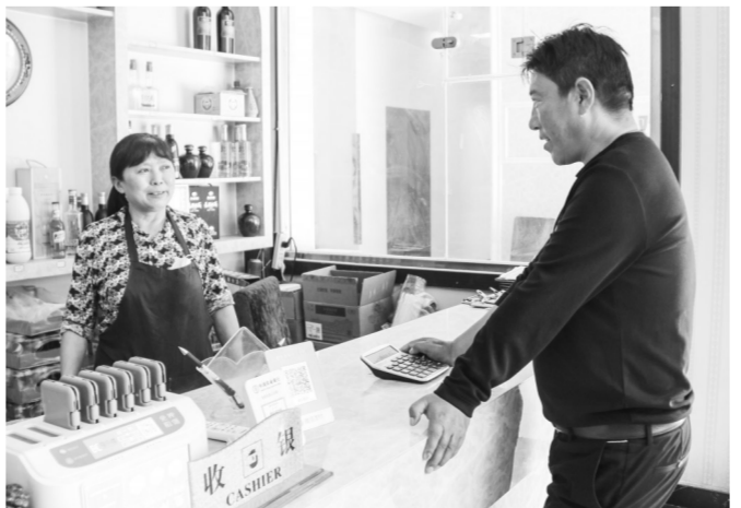
青白(右)到移民出租饭馆了解情况。