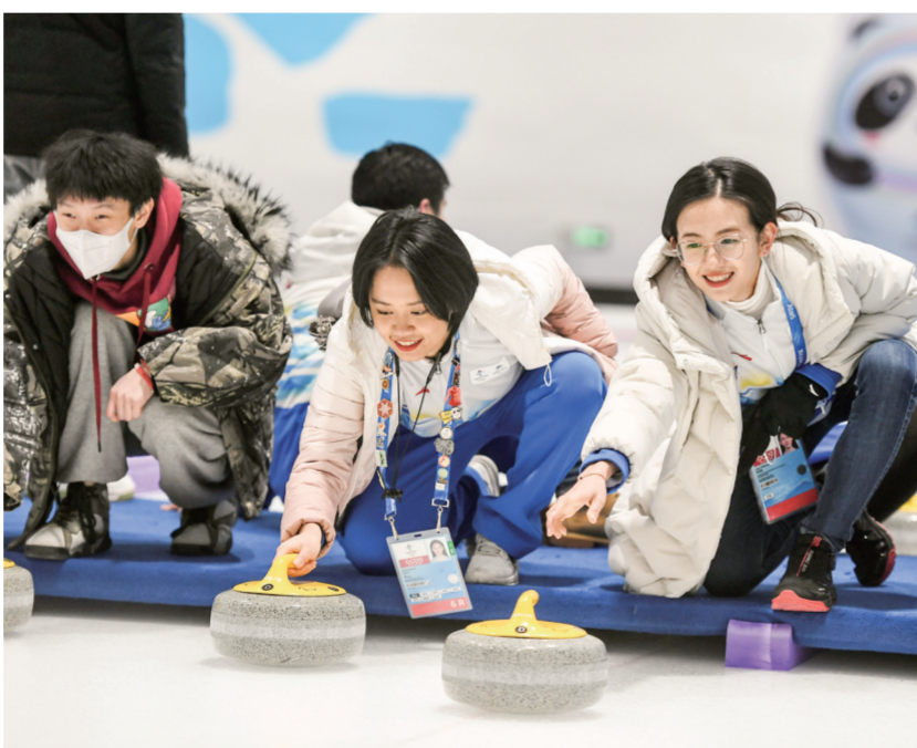
在北京冬奥会一周年之际感受冰上运动魅力。

兔年春节前后，上海推出20多项冬季项目赛事活动，统筹兼顾专业性、群众参与程度。除了十多块固定冰场开门迎客外，上海还新添15块季节性移动冰场，犹如点点银珠缀满黄浦江沿线，更点缀了美丽的城市生活。上海市冰雪运动协会会长严家栋表示：“北京冬奥会成功举办后，南方市民逐渐养成了‘冰雪过节’的习惯。很多上海市民走进冰雪场地，在滑雪中度过