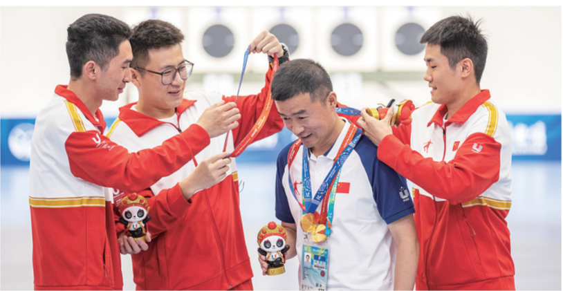
7月30日，中国队队员为教练戴上奖牌。