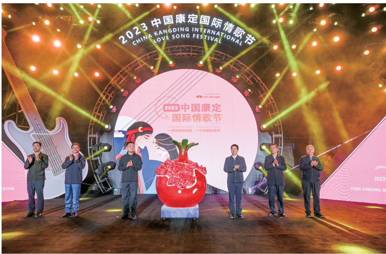
8月22日晚，“情满中国·爱在康定”2023年中国康定·国际情歌节开幕式晚会在情歌广场举行。

一生一贡嘎，一世一情歌。当康定情歌的歌声响彻在康定夜空，整座溜溜城都在音乐中深深沉醉。非遗传承人唱起婉转悠扬的溜溜调，到男女对唱风靡世界的《康定情歌》，再到孩子们用童声演绎的《康定情歌》，唱出了一代代人不同的方式传承和演绎的《康定情歌》。《情归锅庄》热情洋溢，自由奔放；