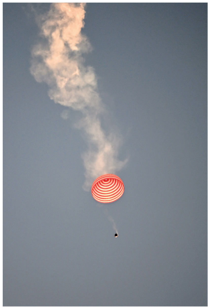
10月31日8时11分,神舟十六号载人飞船返回舱在东风着陆场成功着陆,神舟十六号载人飞行任务取得圆满成功。