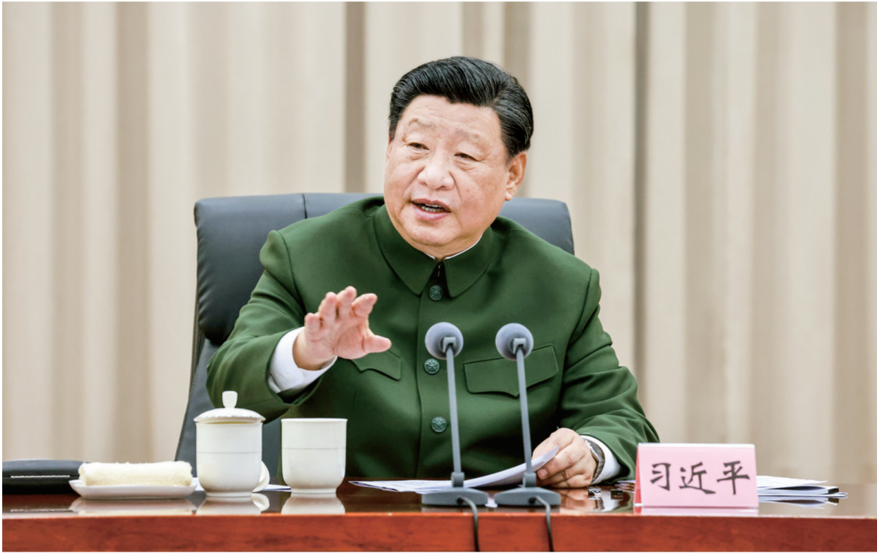
11月29日，中共中央总书记、国家主席、中央军委主席习近平到武警海警总队东海海区指挥部视察。这是习近平发表重要讲话。

習近平強調，要全面加强指揮部黨的建设，確保政治過硬。第二批主題教育正在深入开展，要力戒形式主义、官僚主义，切实解决实际问题，取得扎实成效。要严格教育管理，狠抓经常性基础性工作落实，确保秩序正规、安全稳定。