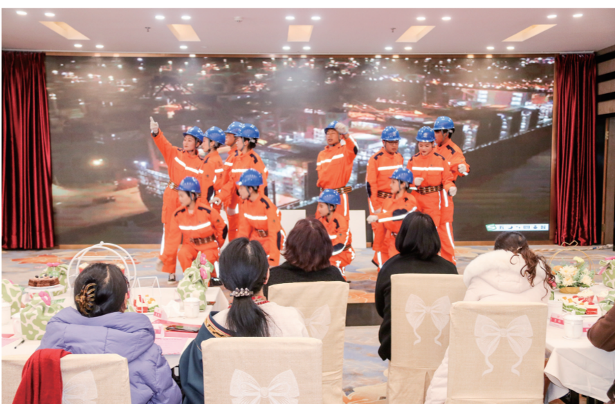
精彩节目让现场氛围热闹万分。