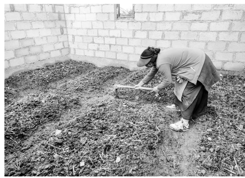
图为村民正在种菜。