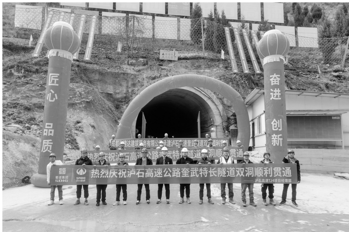
建设者们庆祝隧道贯通。

截至目前，泸石高速本年累计完成投资4.89亿元，占年度目标26亿元的18.81%，自开工累计完成投资