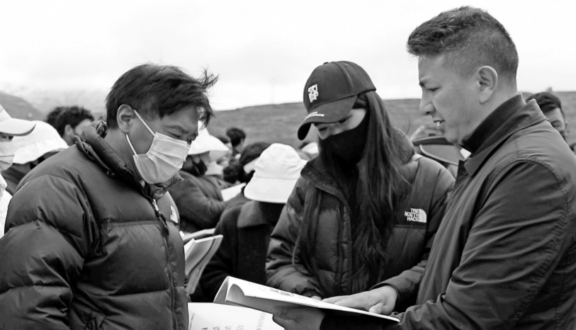
发放机械使用书籍。

甘孜日报讯 进入5月，康巴高原又迎来一年一度的虫草采挖季。连日来，理塘虫草采挖“大军”携带一家老小，开着大大小小装满行李的车辆，排队分批次有序进山采挖冬虫夏草，他们将“常驻”在海拔4000多米的高原雪山，进行为期近两个月的虫草采挖。