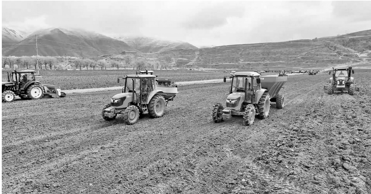
新农机全程全面作业现场。

廊建设。为此，该县采取了五个方面的措施，第一是建设良田。截至目前，已建成高标准农田7.4万亩，剩余的8.2万亩将全面建成高标准农田；第二是推广良种。已建成全国涉藏地区最大最好的青稞制种中心，依托这个制种中心，主要推广康青9号、康青11号、藏青3000等品种；第三是推进全程全面机械化。依托农机购置补贴政策，大力提升农机装备水平，提高“耕、种、收”的综合机械化水平。截至目前，全县农机总动力达到了9.9万千瓦，拥有各类农机6694台，“耕、种、收”的综合机械化作业水平已经达到了88%；第四是实行良法。目前已经组建甘孜县康北青稞现代农业园区专家工作站，并依托四川省农业机械科学研究所和州农机推广服务中心的专家，大力实施标准化的青稞高产增产技术；第五是构建良制。以“园区+公司+合作社+农户+专家工作站”的模式，全面提升青稞的产量，提高青稞的总产量，全面建成新时代更高水平的川西北高原粮仓。