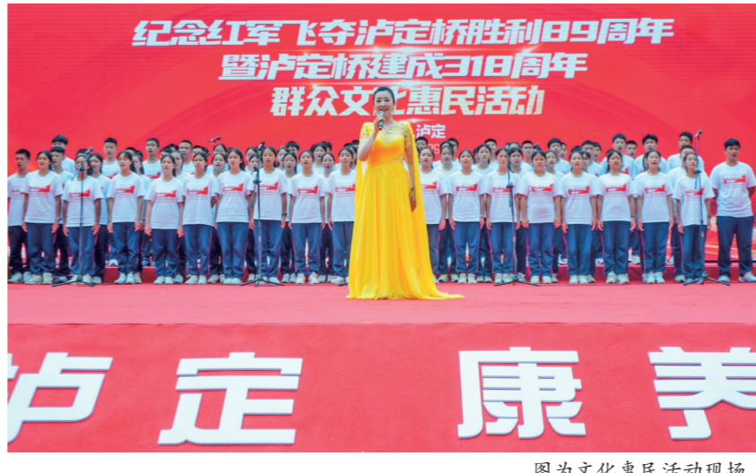
图为文化惠民活动现场。

甘肅日報訊 “金沙水拍崖崖暖，大渡橋橫鐵索寒。”一首《七律·長征》寫出了紅軍飛奪瀘定橋的“驚、險、奇、絕”，歷史的烽煙被縈繞在此；紅軍“飛奪瀘定橋”的壯舉，讓瀘定這座小城一躍成為“紅色名城”。為紀念紅軍飛奪瀘定橋勝利89周年暨瀘定橋建成318周年，5月29日，一場以“一座橋的光輝歷程”為主題的2024瀘定縣紀念紅軍飛奪瀘定橋勝利89周年暨瀘定橋建成318周年群眾文化惠民活動在瀘定橋廣場燃情舉辦。