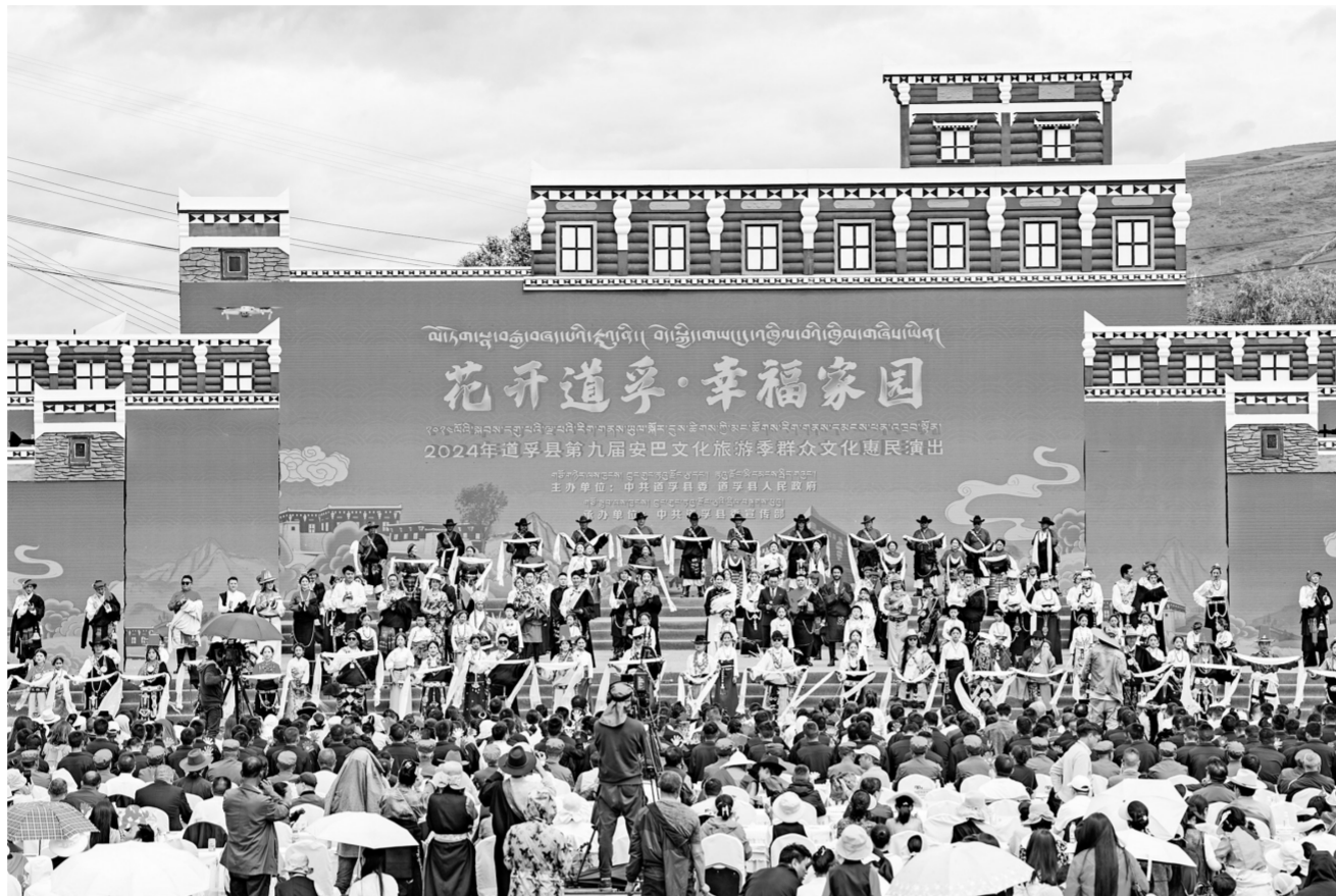
安巴文化旅游季群众文化惠民演出现场。

“原藏民十三团的事迹太感人了，致敬每一位无私奉献的先辈们，希望老战士们身体健康。”演出受到当地群众的一