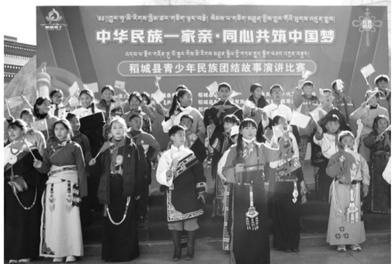
图为演讲比赛现场。

近日,稻城县举办了“中华民族一家亲,同心共筑中国梦”青少年民族团结故事主题演讲比赛,旨在激励广大青少年坚定理想信念,展现朝气蓬勃、奋发有为、勇于担当的精神风貌。