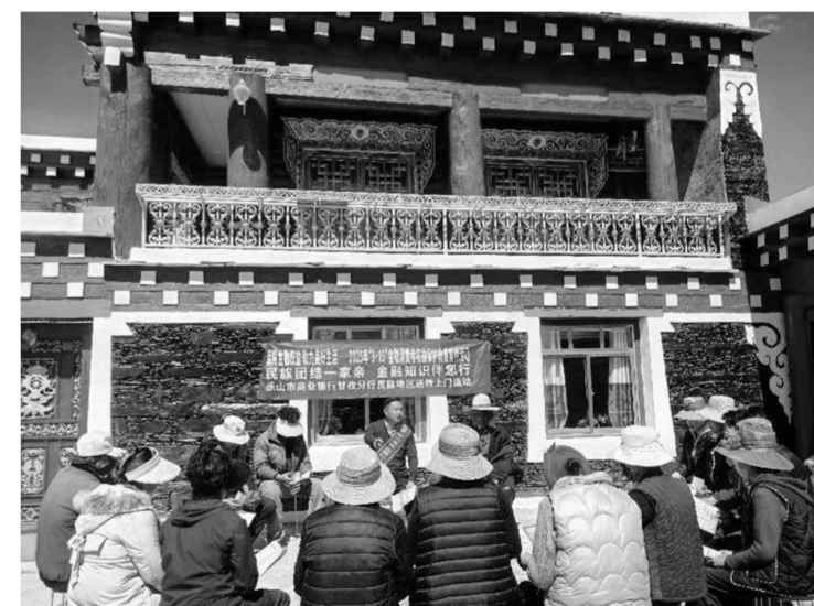
宣教团队向村民宣传金融知识。

本报讯 在“3·15国际消费者权益日”到来之际，乐山市商业银行甘孜分行宣教团队来到道孚县，通过“接地气”“有温度”的宣传方式，将金融知识送到田间地头、农牧民家中，助力乡村振兴，服务地方经济发展。