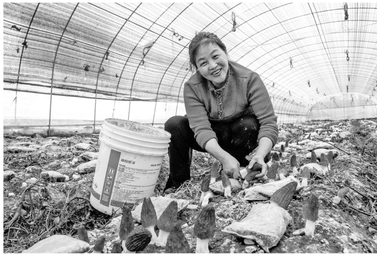
忙着采收羊肚菌的村民脸上洋溢着丰收的喜悦。

春意渐浓，万物竞发。在泸定县德威镇堡子村的羊肚菌种植基地里，一朵朵棕褐色的羊肚菌如雨后春笋般破土而出，菌盖饱满、纹理清晰，村民们正弯腰忙碌采收，脸上洋溢着丰收的喜悦。这片曾经以传统作物为主的土地，如今因羊肚菌的“落户”，焕发出乡村振兴的新活力。