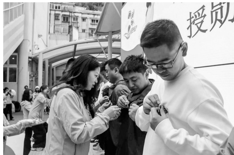
为“五星萌爸”佩戴勋章。

本报讯 9月22日，州幼儿园内，大班幼儿礼仪队手持啦啦花整齐列队，用稚嫩而响亮的声音喊着“萌爸，萌爸，欢迎萌爸！”一场别开生面的“五星萌爸”计划启航仪式在这里开启。