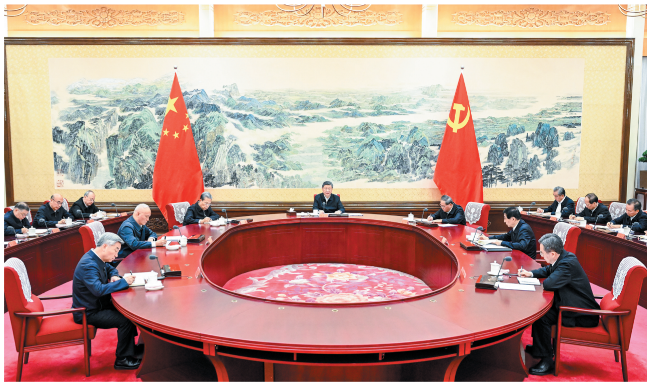
十二月二十五日至二十六日,中共中央政治局召开民主生活会,中共中央总书记习近平主持会议并发表重要讲话。新华社记者 谢环驰 摄

新华社北京12月26日电 中共中央政治局于12月25日至26日召开民主生活会,深入学习贯彻习近平新时代中国特色社会主义思想,全面贯彻党的二十届四中全会精神,围绕锲而不舍落实中央八项规定精神,推进作风建设常态化长效化,结合思想和工作实际进行自我检视、党性分析,开展批评和自我批评。