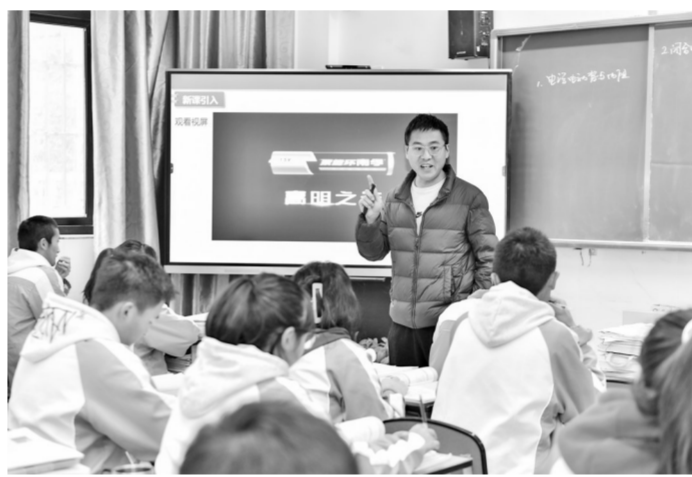
学生正在专心听课。

在九龙县中学，新建教学楼项目顺利落成投用。新教学楼严格按照现代化办学标准规划建设，不仅配备了标准化教室、多功能实验室、图书阅览室等教学空间，还融入了智慧黑板、护眼照明等现代化教学设施。同时，优化了通风采光设