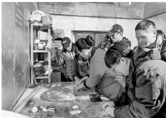
电影《团圆年》剧组人员体验做“花茹”。