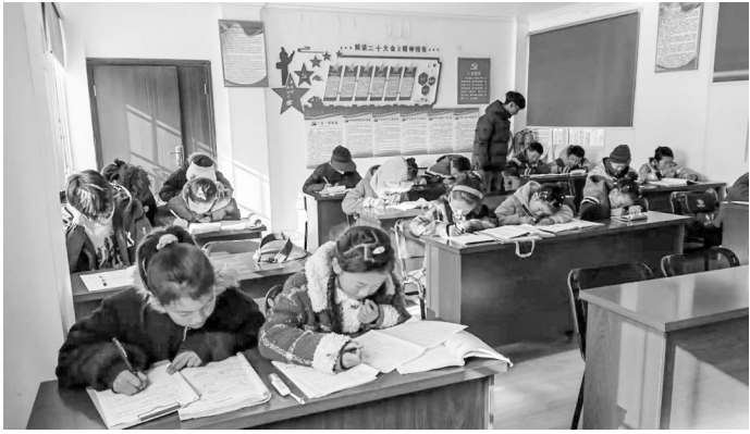
孩子们正在写作业。

本报讯 假期来临,道孚县孔色乡约尾村的孩子们常成“脱缰小马”,家长或忙于农活务工,或因文化程度有限无力辅导,这时孩子们要么宅家沉迷电子产品,要么结伴在野外瞎跑,让家长们忧心忡忡。该村党支部与驻村工作队看在眼里,动在实处,迅速启动“假期学习屋”建设,将村活动室收拾规整,配齐桌椅笔墨,让红色阵地变身孩子们的“假期乐园”。同时组建由党员干部、驻村队员、返乡大学生组成的志愿团队,既当“课业辅导员”,又做“临时家长”。