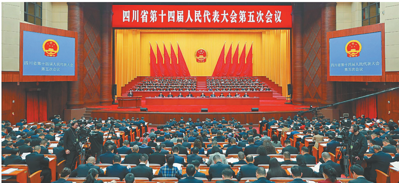
2月3日,四川省第十四届人民代表大会第五次会议在成都开幕。

2月3日上午,四川省第十四届人民代表大会第五次会议在成都开幕。肩负全省人民的重托,来自各条战线的省人大代表齐聚一堂,共商四川发展大计。