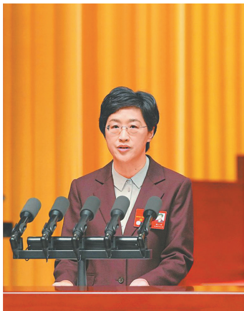
省长施小琳代表省人民政府作工作报告。