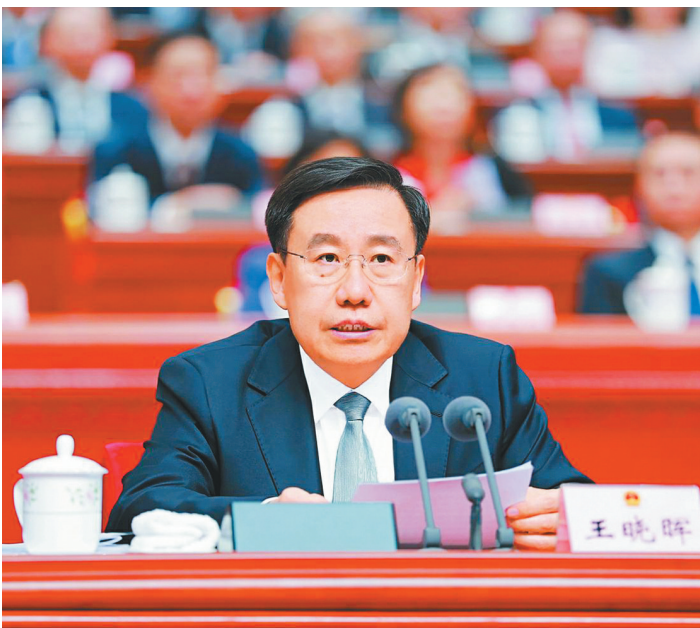
大会主席团常务主席、开幕会执行主席王晓晖主持开幕会。