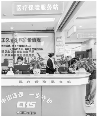
医保一站式服务及就诊一站式服务。