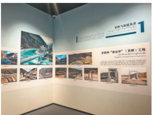
甘孜州“尚巴甲”(百桥)工程图片展。