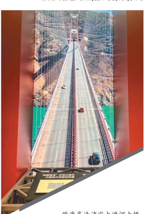
雅康高速泸定大渡河大桥。