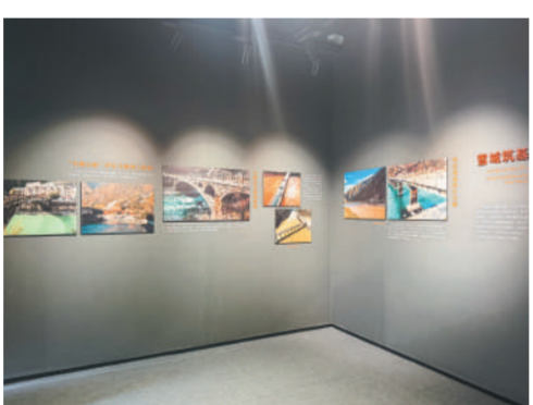
甘孜州桥梁文化展内的图片展。