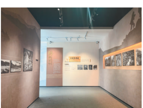
甘孜州桥梁文化展里的图片展示。